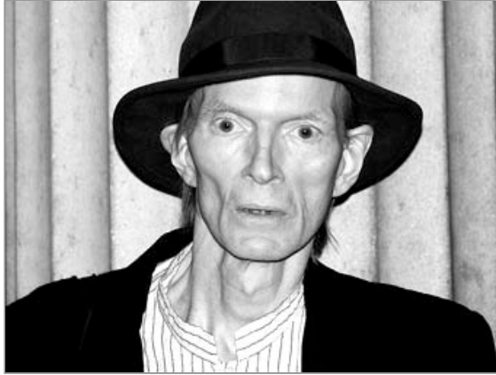
Джим Кэрролл.